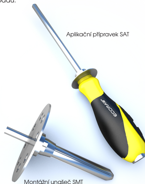
Aplikační přípravek SAT